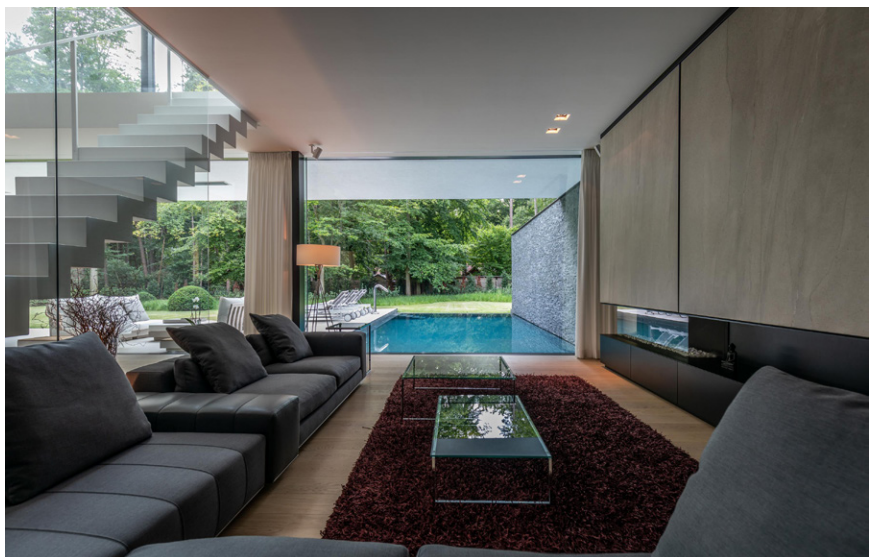
De haardenbouwers van AMA haarden brachten extra sfeer in de woning.

De wanden van de inkomhal werden voorzien van inbouwkasten die dienst doen als vestiaire en opbergruimte voor schoenen. Ook het gastentoilet werd hierin verwerkt. Meteen valt de overvloedige lichtinval op, dankzij de zuidgerichte achtergevel die volledig uit plafondhoge ramen en schuifdeuren met verzonken dorpels bestaat. Wegens hun formaat en gewicht bevinden deze schuiframen zich op de limiet van wat technisch realiseerbaar is. Om dezelfde reden werd het grootste schuifraam gemotoriseerd. De openheid van de benedenverdieping is opmerkelijk. Links van de inkom bevindt zich de open keuken, het rechtergedeelte is voorbehouden aan de eetruimte en de zithoek. De enige scheidende elementen die zich in deze grote ruimte bevinden, zijn de stalen trap in witte matgelakte uitvoering, geflankeerd door een plafondhoge wand in helder glas die de zithoek definieert. Ter hoogte van de eetruimte zorgt een monumentale vide voor extra lichtinval en een vrij zicht op de nachthal.