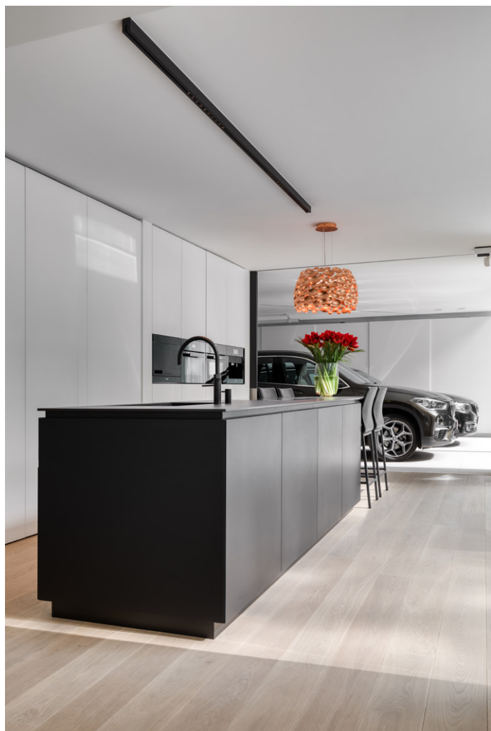
De bewoners beschikken over instant kokend water met de Quooker kokendwaterkraan.

De witte stalen trap leidt naar de nachthal. Ballustrades in helder glas zonder tussenstijlen vergroten het effect van licht en openheid. Rechts bevindt zich de mastervleugel met een grote slaapkamer, voorzien van een vrijstaand designbad en ensuite badkamer met royale inloopdouche. Vanuit de slaapkamer heeft de heer des huizes toegang tot zijn thuishkantoor. De achterwand van de inloopdouche wordt gevormd door een epoxy kunstwerk van Turco. Glazen afscheidingswanden werden voorzien van een sfeervolle, geïntegreerde ledverlichting. De badkamerwand werd uitgevoerd in wit gelakt glas. De dressing bevindt zich tussen de master bedroom en doucheruimte. Aanpalend is er een wasruimte voorzien. Een niet evidente maar toch logische keuze om deze daar onder te brengen.