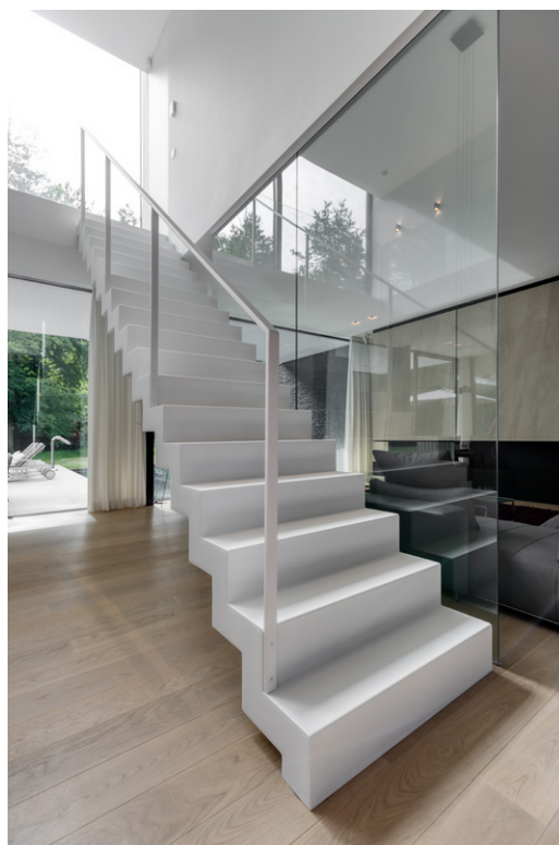
De witte trap werd uitgevoerd in staal en glas.