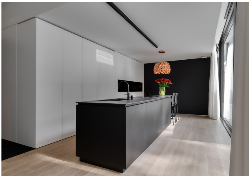
Trouilliez interieur realiseerde de unieke keuken op maat.

Het cleane en strakke karakter van het architecturaal ontwerp wordt verder ondersteund door een minimaal kleur- en materiaalgebruik. Als vloerbedekking werd beneden overal gekozen voor een massief eiken parket. Er werd enkel gewerkt met de kleuren wit, zwart en naturel beige. In de ergonomisch geconcepioneerde keuken werden werkblad, aanbouwtafel en keukeneiland in zwarte Dekton met verschillende afwerking