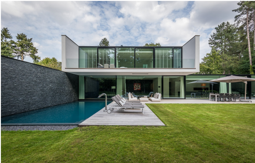
Het buitenmeubilair is afkomstig van Buitenhof Tuinmeubelen.

Links van de nachthal is het domein van de tienerzoon met een al even royale douche-ruimte. Voor de vloer in deze douchekamer werden dezelfde tegels gebruikt als voor het terras beneden. Opvallend in beide douchekamers is de grote lichtstraat bovenaan. De enthousiaste vrouw des huizes merkt op: "Wanneer we 's avonds douchen dan kunnen we de sterrenhemel boven ons bewonderen, wat toch wel een heel apart gevoel geeft."