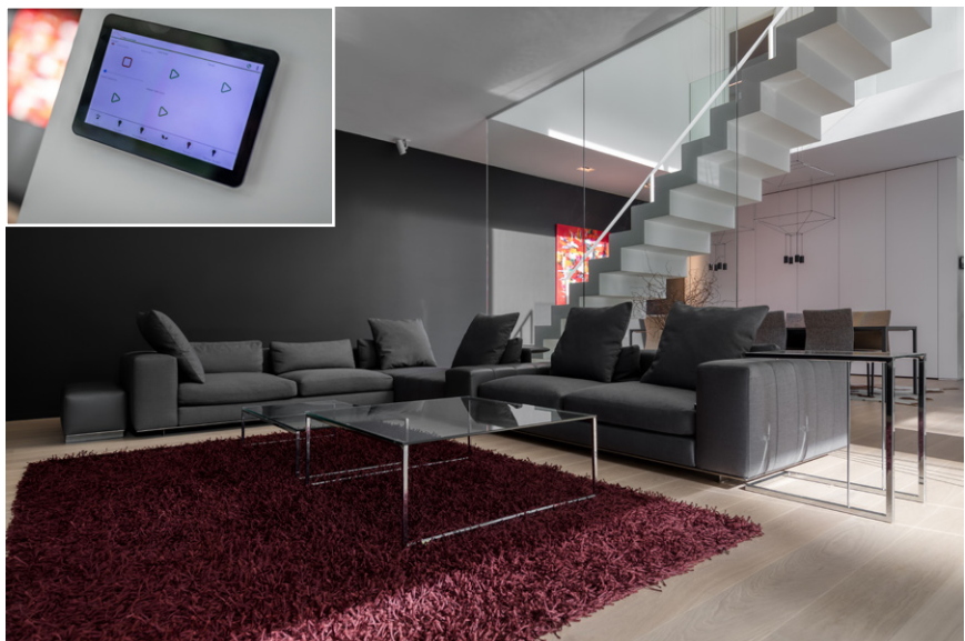
De woning werd voorzien van geavanceerde domotica door IPBuilding.