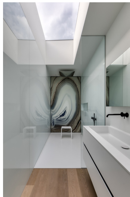
Ventico voorzorg in de warmte-installaties, zoals airco, ventilatie en een warmtepomp.