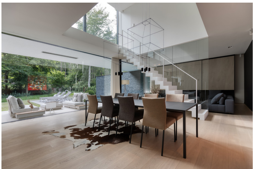
L.A. Ramen Lanssens leverde het ambachtelijk, aluminium schrijnwerk.

De bouwheren wisten hun wensen duidelijk te formuleren. Een belangrijke vereiste was openheid en contact met buiten om zo een permanent vakantiegevoel op te wekken. Door hun drukke job wilden ze ook optimaal genieten van de vaak schaarse momenten die ze samen en met hun tienerzoon thuis zouden doorbrengen. De leefruimte moest zo open mogelijk zijn om connectie te bevorderen. Hierdoor werd het gelijkvloers ontworpen als een volledig open, balkvormig volume met daarop een tweede volume dat de slaapvertrekken herbergt. Het interieur moest tevens makkelijk netjes gehouden kunnen worden, vandaar de alomtegenwoordige inbouwkasten en schuifwanden. Langs de straatkant is de gevel gesloten, enkel subtiel onderbroken door de voordeur en de grote geïntegreerde garagepoort in cederhout. De enige toegeving die de architect moest doen inzake strakheid van het ontwerp, is het gebruik van Muretto nero steenstrips over de hele breedte van de gelijkvloerse voorgevel. Dit was een uitdrukkelijke wens van de bouwheren om een warme, speelse toets aan het ontwerp toe te voegen. Wat ook heeft meegespeeld in de uiteindelijke keuze voor modern, is het feit dat met beton grotere overspanningen en dus grotere open ruimtes mogelijk waren. Met als resultaat meer nuttige ruimte voor eenzelfde budget.