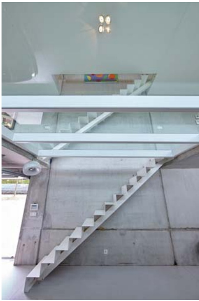
Het indrukwekkende trappenhuis.