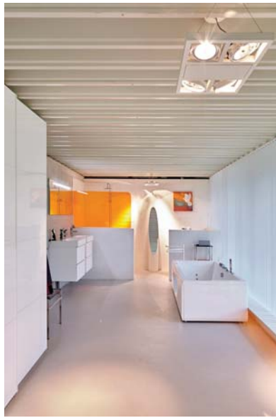
Santherm voorzag de woning van alle installaties m.b.t. de sanitaire voorzieningen.