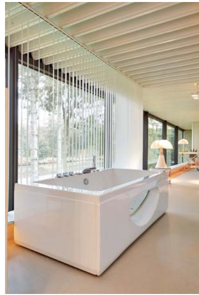
Vanuit het bad kijkt men uit op het kanaal in de groene omgeving.