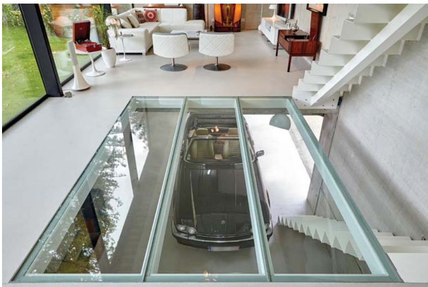
Grote doorkijk naar de kelder vanuit de living. De eigenaar kan zo te allen tijde genieten van zijn klassieke bolide.

De inspiratiebron voor het huis was een showroom met auto's. De enige auto die er uiteindelijk in zichtbaar is geworden, is die van de eigenaar die in de half in de grond verzonken garage geparkeerd staat en zichtbaar is door een glazen vloer. Het gelaagd glas is zo stevig dat er met een gerust hart