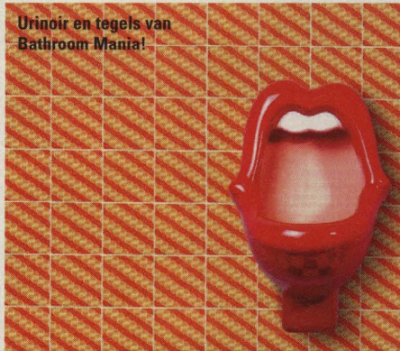
Urinoir en tegels van Bathroom Mania!