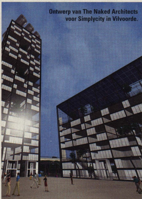
Ontwerp van The Naked Architects voor Simplicity in Vilvoorde.

Twee Belgische ontwerpteam behoren tot de