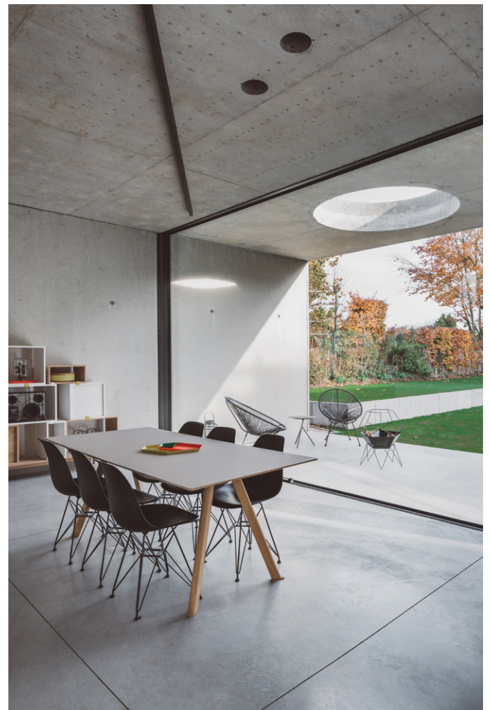
Het buitenschrijnwerk werd geplaatst door ADR Construct (aluminium).