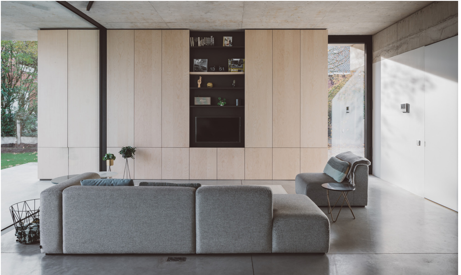
De kastenvolumes zorgen ervoor dat er aparte ruimtes ontstaan.

Een betonnen interieur warm en leefbaar houden, vergt een holistische visie van de architect. Frederik de Smet had van bij zijn eerste voorontwerp reeds het meubilair en de verlichting voor ogen die hiervoor nodig zouden zijn. Om het beton te 'verzachten' werd beslist om in het ter plaatse gestorte plafond de nervenstructuur van de ruwe multiplex bekistingspanelen zichtbaar te houden. Samen met het gewolkte patroon van de gepolierde betonvloer zorgt dit voor een subtiele, natuurlijke toets. Om deze logica aan te houden, werden twee kastenvolumes precies in dezelfde multiplex panelen gerealiseerd.