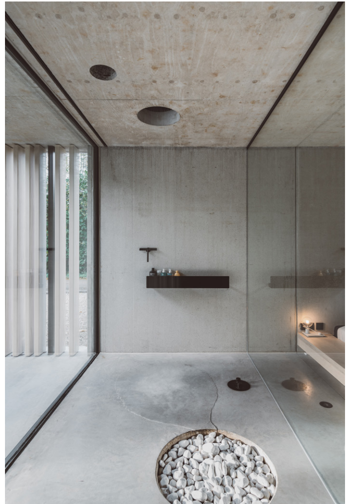
De badkamer werd op maat gemaakt door Schrauben uit Brasschaat.

Via het opengewerkte trapgat loopt de ruimte door in de kinderkamers. Deze werden van de rest van de ruimte afgescheiden door een glazen wand. Net deze openheid zorgt ervoor dat de woning met een beperkte oppervlakte toch zeer ruimtelijk aanvoelt. Het 3,20 m hoge plafond in de leefkamer draagt bij tot dit open gevoel. De leefkamer kreeg een volledig glazen achtergevel, met profielen verzonken in vloeren en wanden.