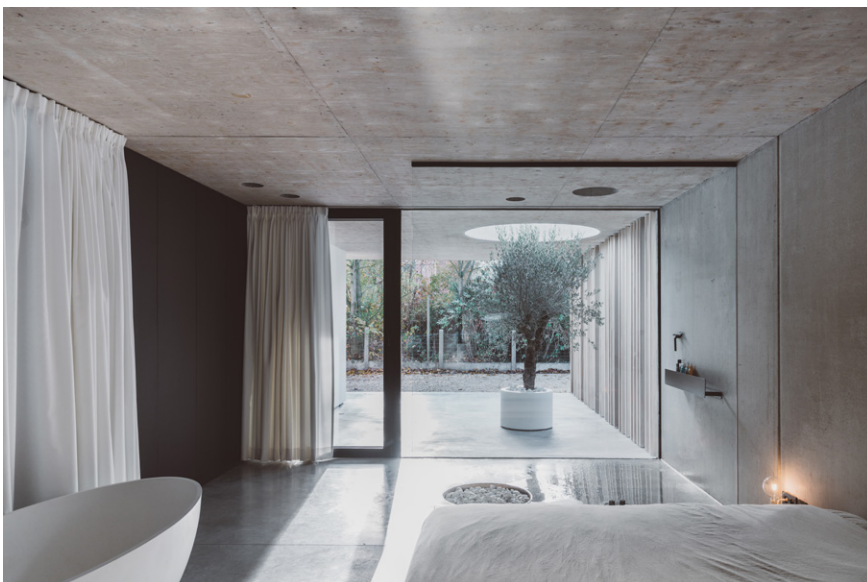
De cirkelvormige uitsparing in het betonnen dak zorgt voor licht en het doorbreekt de strakke lijnen.

De master bedroom wordt van de keuken afgescheiden door de zwarte, glazen ballustrade van de trap en door een wit gordijn. Om meer natuurlijk licht in de slaapkamer te verkrijgen, werd een grote, cirkelvormige uitsparing in het betonnen dak gemaakt. Andere