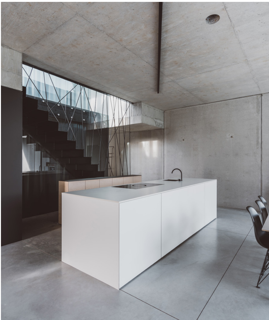
De keuken en de slaapkamer worden van elkaar gescheiden door de ballustrade van de trap.

Het robuuste betonnen volume vormt als het ware een schelp rondom de woonruimtes. Slechts twee strakke kastenvolumes zorgen voor een afscheiding met buiten en voor de definiëring van de de ruimtes. Zo ontstaat er een carport, een inkom, een leefruimte, een terras en een master bedroom.