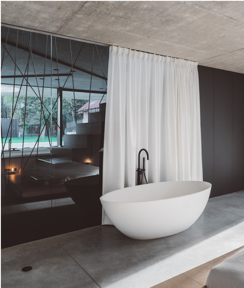
Met een w-installatie van Ventico is de woning niet alleen mooi, maar ook praktisch en comfortabel.

Via het opengewerkte trapgat loopt de ruimte door in de kinderkamers. Deze werden van de rest van de ruimte afgescheiden door een glazen wand. Net deze openheid zorgt ervoor dat de woning met een beperkte oppervlakte toch zeer ruimtelijk aanvoelt. Het 3,20 m hoge plafond in de leefkamer draagt bij tot dit open gevoel. De leefkamer kreeg een volledig glazen achtergevel, met profielen verzonken in vloeren en wanden.